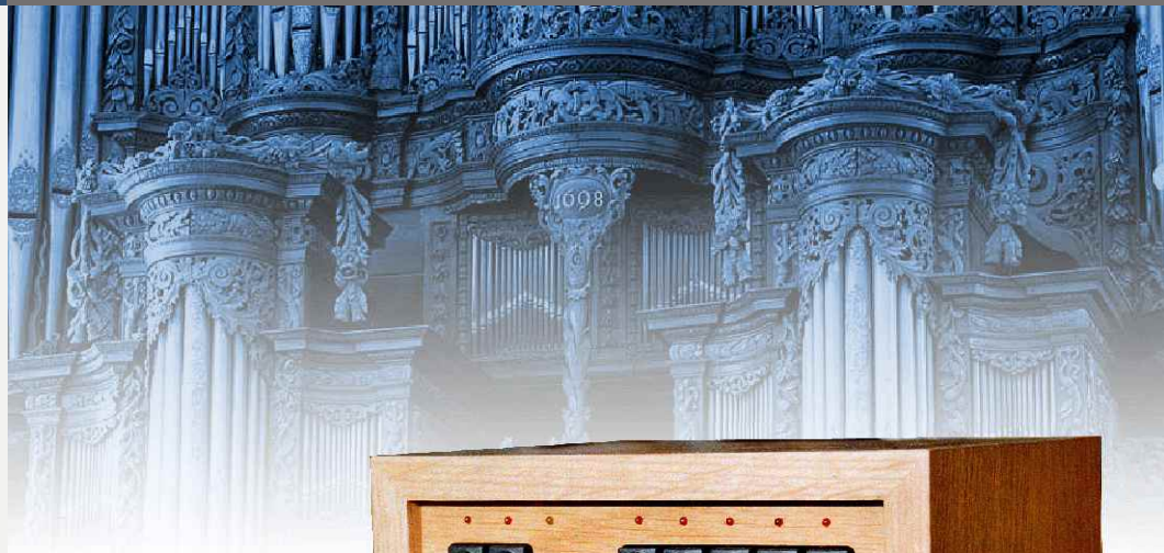
SE-5 in heller Eiche

Sie besitzen eine Sakralorgel, die Sie auch als Möbelstück schätzen, deren Klang aber nicht mehr ganz überzeugt? Ihre Kirchengemeinde verfügt über ein Instrument, dem für romantische Orgelmusik die Register fehlen? Ihnen fehlt schon seit Jahren eine spanische Trompete und eine Unda maris? Dann können wir Ihnen helfen.